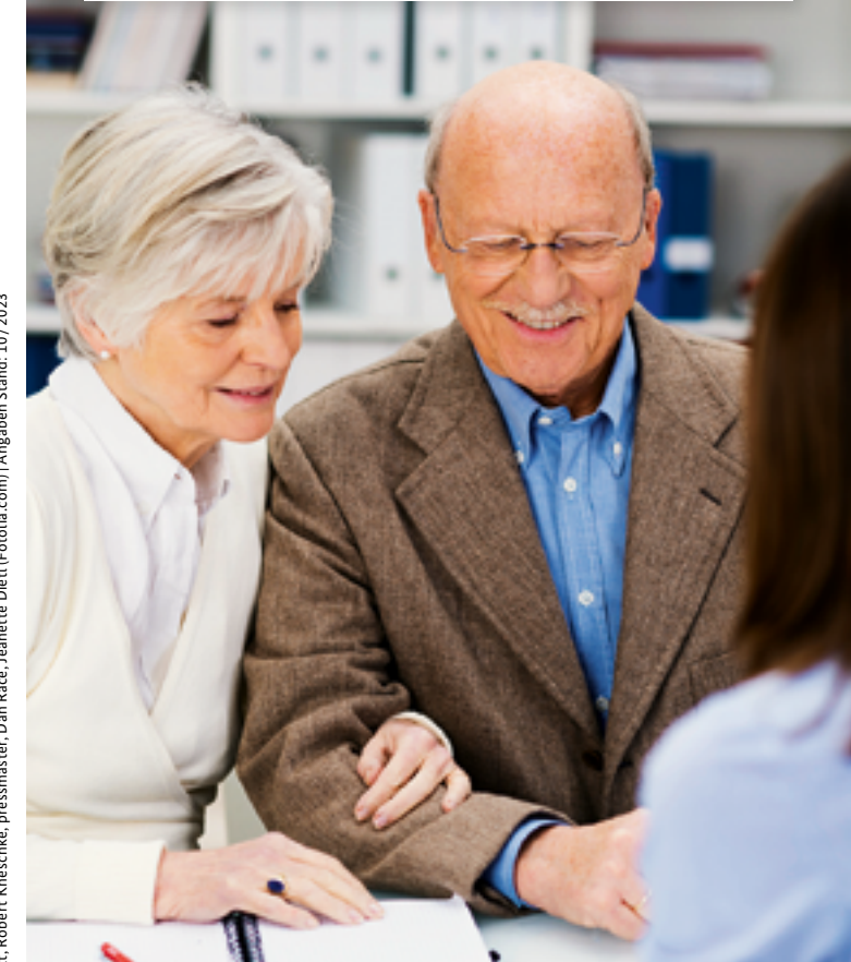
Angaben Stand: 10/2023

RECHTLICHER BETREUUNG BEVOLLMÄCHTIGUNGEN VERFÜGUNGEN